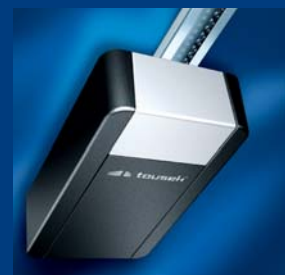
tousek Garagentorantriebe sparsam und schnell